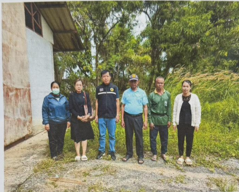
ภาพถ่ายการลงพื้นที่ตรวจสอบความคืบหน้าการแก้ไขปัญหาเรื่องร้องเรียนฟาร์มเลี้ยงไก่บ้านโนนจั่ว ม.๘ ตำบลหินโคน อำเภอลำปลายมาศ จังหวัดบุรีรัมย์