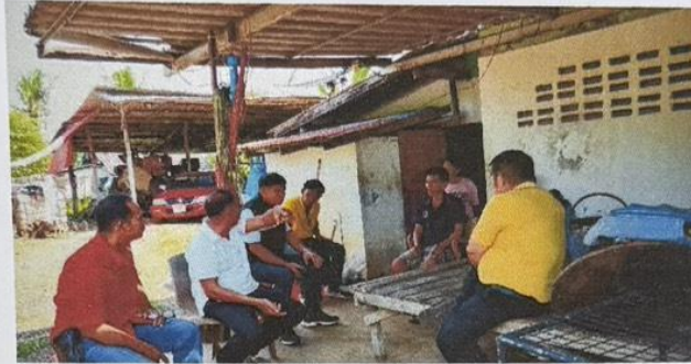
รูปถ่ายการลงพื้นที่ตรวจสอบเรื่องร้องเรียน กรณีมีน้ำท่วมขังจากน้ำที่ไหลมาจากฟาร์มเลี้ยงไก่ “เซ่งเฮงฟาร์ม” บ้านโนนจั่ว หมู่ ๘ ตำบลหินโคน อำเภอลำปลายมาศ จังหวัดบุรีรัมย์ เมื่อวันที่ ๗ ตุลาคม ๒๕๖๘