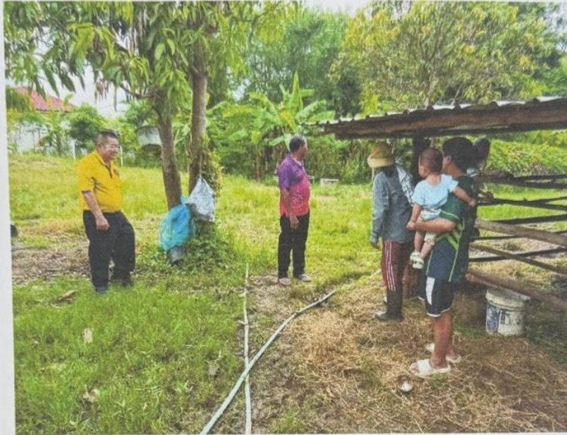
รูปถ่ายการลงพื้นที่ตรวจสอบเรื่องร้องเรียน บ้านโนนจิว หมู่ ๘ ตำบลหินโคน อำเภอลำปลายมาศ จังหวัดบุรีรัมย์