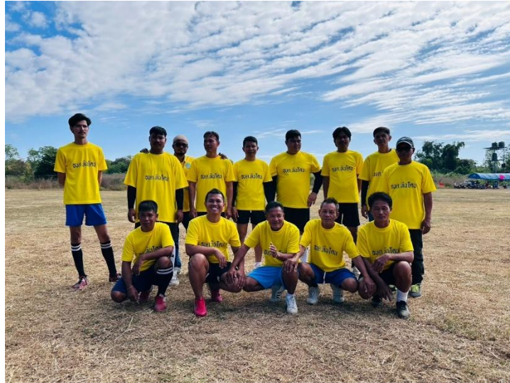
พนักงาน อบต. เข้าร่วมแข่งขันกีฬาต้านยาเสพติด “หินโคนคัพ” ประจำปีงบประมาณ พ.ศ. ๒๕๖๘